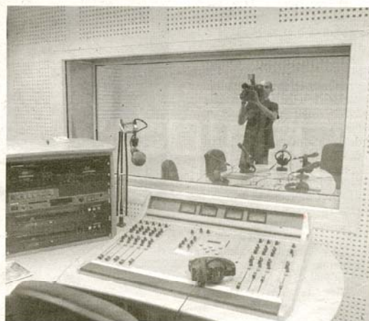
Estudio de radio. / ALFONSO E. CAÑO

Para contribuir a alcanzar ese objetivo, la Facultad de Ciencias Humanas y de la Información cuenta con suficientes medios técnicos como un estudio de radio de tecnología digital de última generación, un estudio fotográfico, «y de cara al próximo curso, los alumnos realizarán prácticas en el plató de Televisión Castilla y