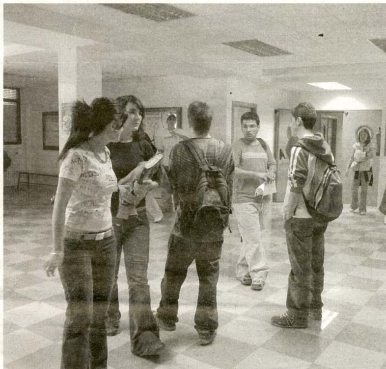
Las instalaciones son amplias, para que el universitario se encuentre cómodo.

Una vez cumplidos los requisitos, el alumno podrá realizar la matrícula. Existen dos plazos: del 1 de junio al 12 de agosto, y del 1