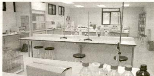
Laboratorio de Enología.

A su vez, estos estudios, muy en boga actualmente, cualifican para la organización y control de los procesos de elaboración de vinos, su cuidado y correcto tratamiento, así como para la dirección de empresas encargadas de su comercialización, con especial atención a la exportación.