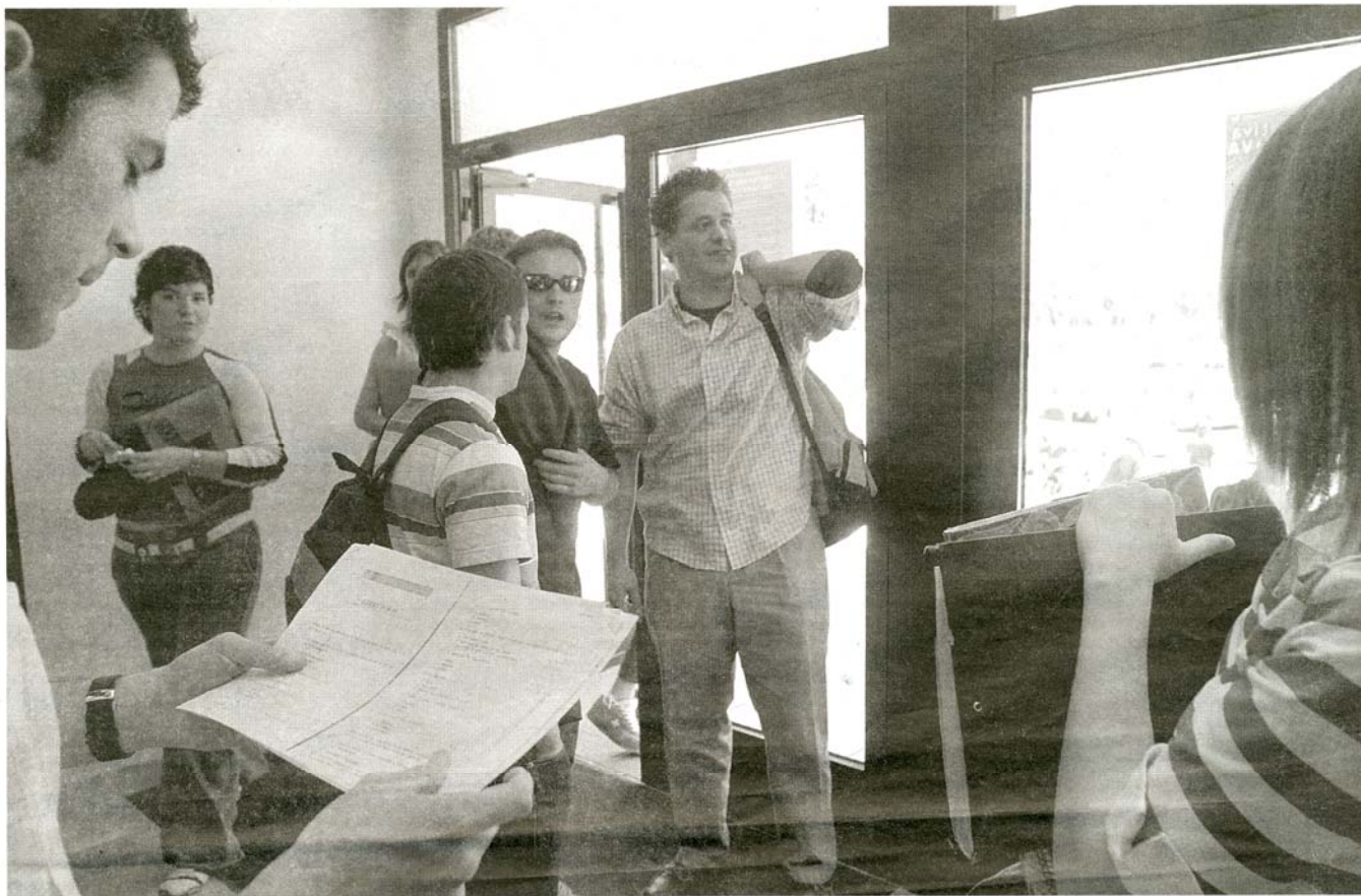
Universitarios en una de las entradas a la UEMC.