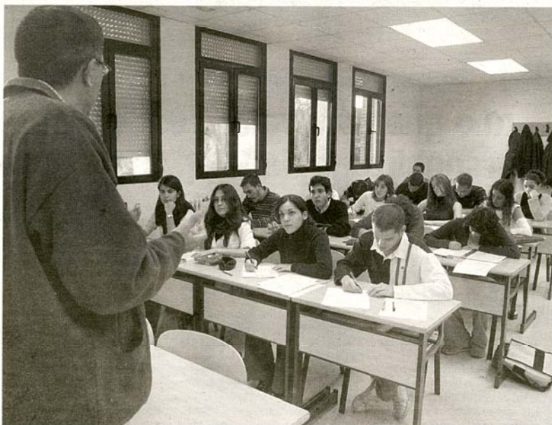
Un profesor imparte clase en la Diplomatura en Turismo.

En ella se imparte la diplomatura en Ciencias Empresariales y la de Turismo