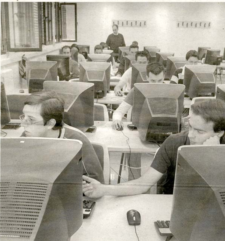
Los alumnos en un aula que dispone de 46 ordenadores.

Esta Escuela tiene firmados más de 70 convenios con diferentes empresas, que acogen perfectamente a los universitarios de la UEMC